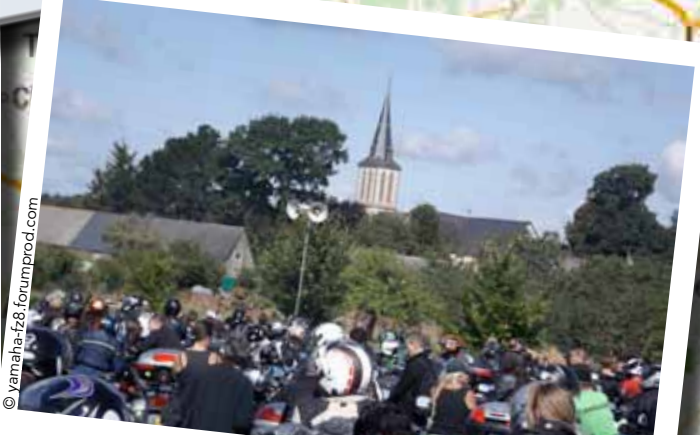
En attendant la bénédiction du 15 août