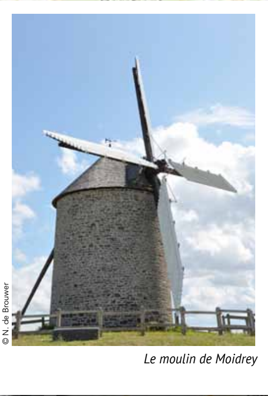
Le moulin de Moidrey