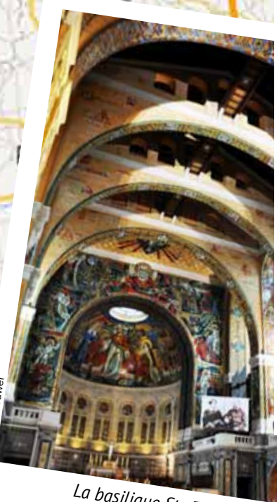
La basilique Ste Thérèse de Lisieux

En TV: le dim. 02/11 à 9h20 sur La Une (RTBF) Rediffusions: le sam. 08/11 à 10h30 sur La Une, le merc. 12/11 à 18h55 sur La Trois.