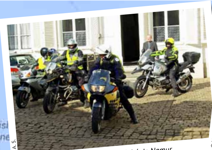
Le team belge au départ de l'évêché de Namur